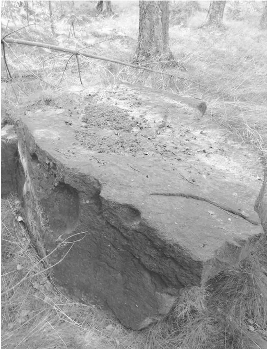
Obrázek č. 1/1